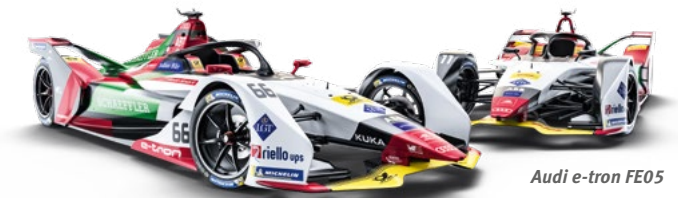
Audi e-tron FE05

Punktesystem 1. 25 Pkt. 2. 18 Pkt. 3. 15 Pkt. 4. 12 Pkt. 5. 10 Pkt. 6. 8 Pkt. 7. 6 Pkt. 8. 4 Pkt. 9. 2 Pkt. 10. 1 Pkt.